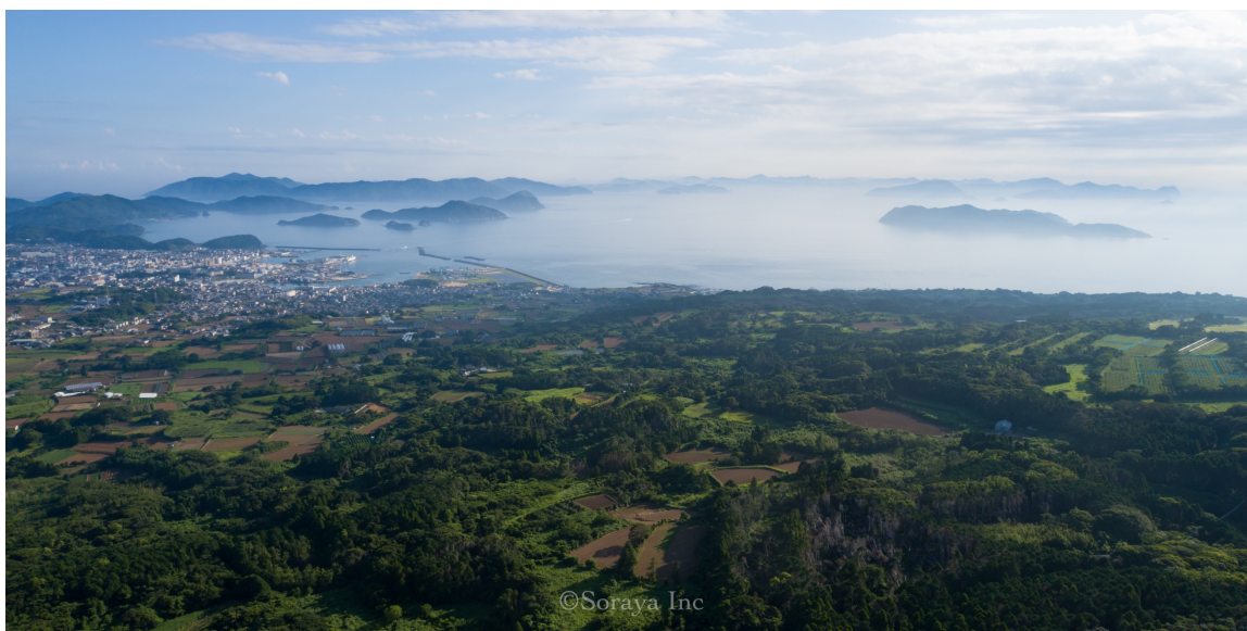
五島市福江島から望む福江港周辺